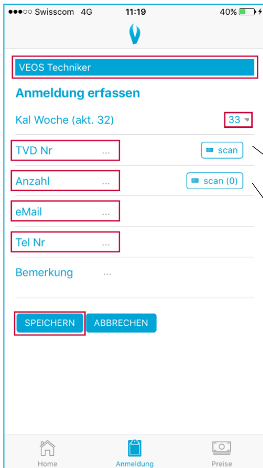
Abbildung 5 Anmeldung für VEOS Techniker

Als VEOS Techniker angemeldet, können Tränkeranmeldungen eines beliebigen Betriebes erfasst werden (Abbildung 5).