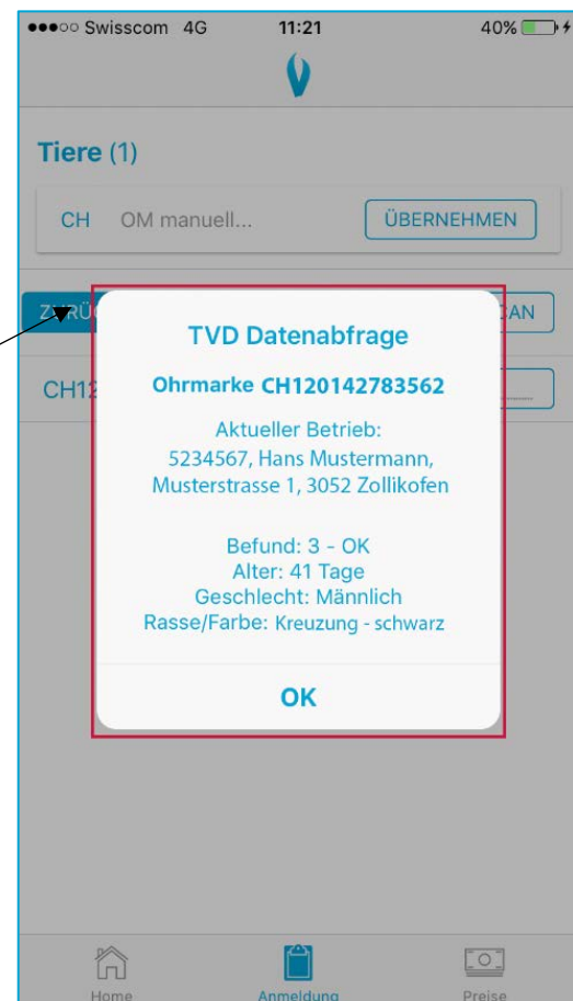
Abbildung 7 TVD Datenabfrage nachdem die Ohrmarkennummer erfasst wurde