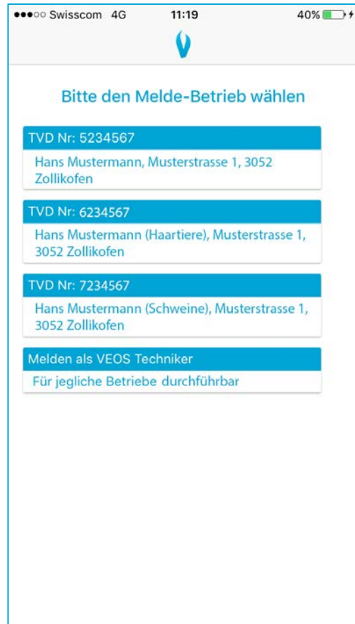
Abbildung 2 Auswahl Betrieb