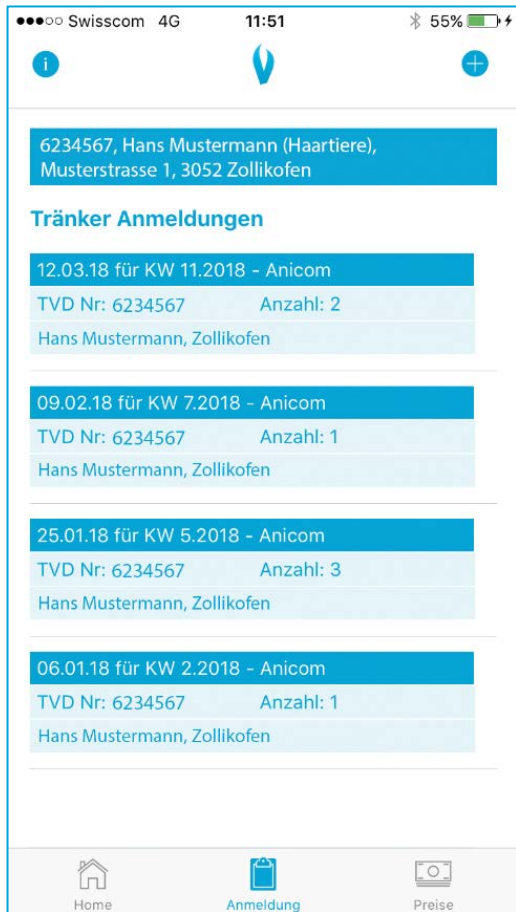
Abbildung 3 Übersicht der erfassten Tränkeranmeldungen

Einmal eingeloggt bleiben die Login-Daten gespeichert. Nach erfolgreichem Login und allfälliger Betriebsauswahl gelangt man auf die Übersichtseite und sieht bereits erfasste Tränkeranmeldungen (Abbildung 3).